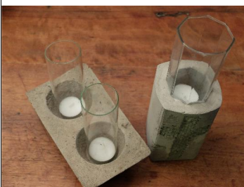
So könnten Ihre Beton-Kunstwerke aussehen!

Mitgebracht werden sollen ausgespülte Tetrapak-Tüten, Joghurtbecher oder andere Kunststoffgefäße und kleine Gläser, in die ein Teelicht passt. Wir freuen uns auf viele "Betongießer" (und Spender)!