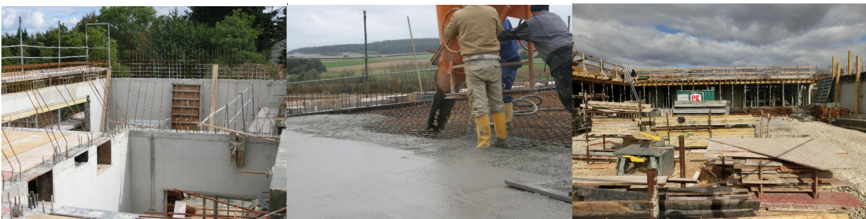
Das neue Gemeindezentrum entwickelte sich bei den Rohbauarbeiten beeindruckend schnell!

In den Tagen darauf ging die Baufirma Paul Ettenreich aus Ehekirchen bereits zügig ans Werk, was dann bereits beim grandiosen Baustellenfest am 24.07. begeistert zu verfolgen war. Günstige Wetterbedingungen, äußerst fleißige Mitarbeiter der Fa. Ettenreich sowie eine sehr gute Abstimmung mit dem Architekturbüro Diezinger aus Eichstätt ließen daraufhin in den folgenden Wochen das neue Gemeindezentrum Wand um Wand und Decke um Decke wachsen.