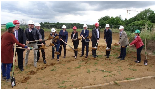
Der offizielle Spatenstich am 15.07.2016.

Und wenn auch beim Spatenstich am 15. Juli noch nicht allzu viel „geschafft“ wurde, war es doch für alle ein bewegendes Ereignis und so kamen neben den Akteuren viele interessierte Menschen zum Grundstück.