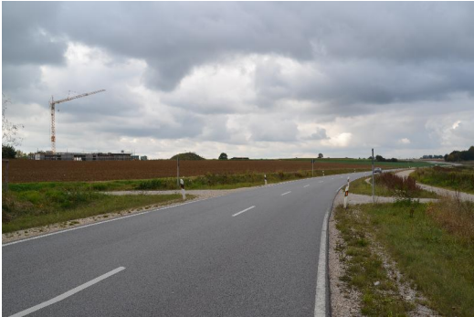
Das Gemeindezentrum mit der Nordtangente.

Facebook: http://bit.ly/fb-bau-gemeindezentrum